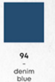
Denim ROCK CHEF® -Stage2 Latzschürze | Bib Apron

Maße: 75 x 90 cm (Breite x Länge) Dimensions: 75 x 90 cm (width x length) Artikelnummer | Item number: RCLS 16