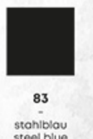
ROCK CHEF® -Stage2 Latzschürze | Bib Apron

Maße: 75 x 90 cm (Breite x Länge) Dimensions: 75 x 90 cm (width x length) Artikelnummer | Item number: RCLS 17